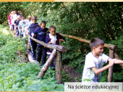
Na ścieżce edukacyjnej