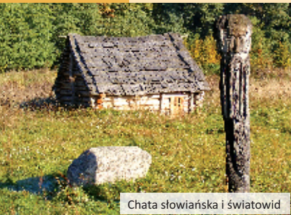
Chata słowiańska i światowid