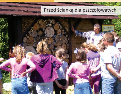
Przed ścianką dla pszczołowatych